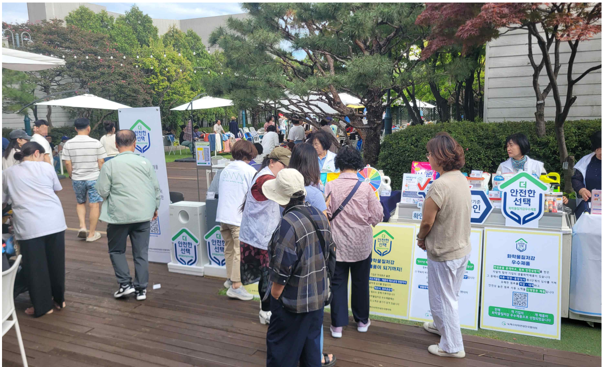
▲ 지난 9월 28일 현대백화점 미아점 하늘정원 그린마켓에서 열린 '화학물질저감 우수제품' 홍보 캠페인 모습

녹색소비자연대전국협의회(이사장 전인수·박인례)는 지난달 28일 서울, 안산, 제주 지역에서 '화학물질저감 우수제품(이하 화우품)' 홍보 캠페인을 진행했다고 3일 밝혔다.